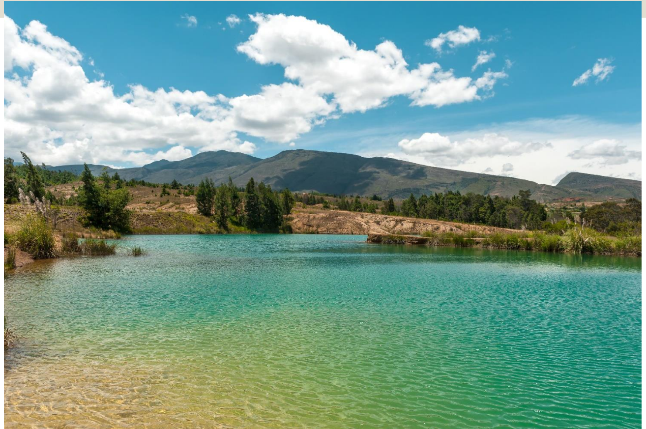
POZOS AZULES, Villa de Leyva, Boyacá, Colombia.

DOCUMENTO DE IDENTIFICACIÓN. Eliminación la mención "NUIP" como de identificación en los actos escriturarios y en los datos de inscripción en el registro inmobiliario. IA No. 10 de 17 junio de 2020. Alcance del artículo 22 de la Ley 962 de 2005. (...)